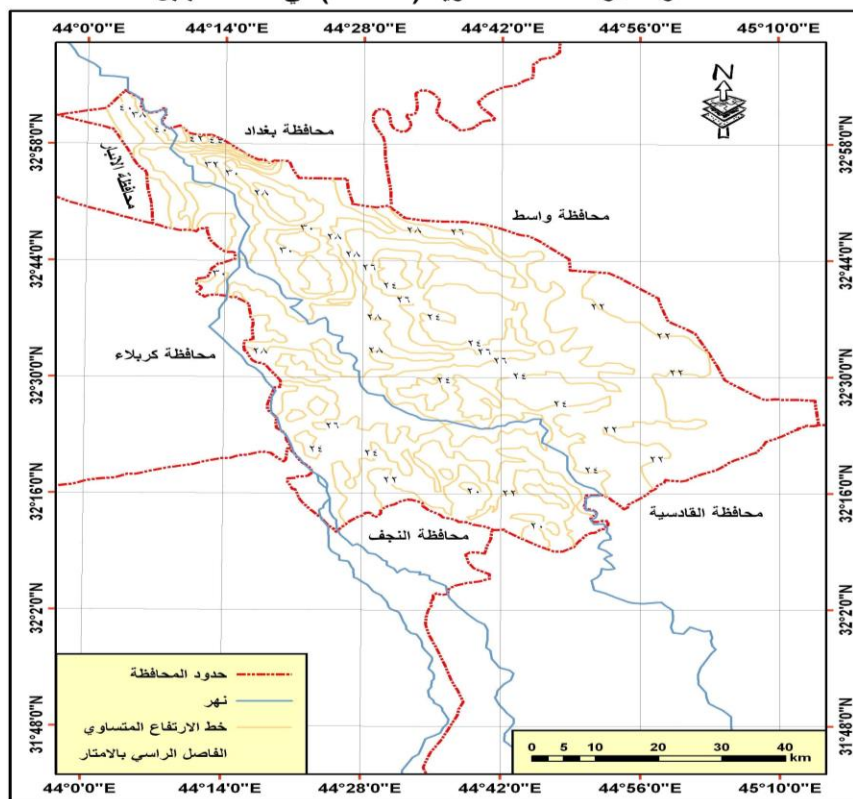
خطوط الارتفاعات المتساوية ( الكفاف ) في محافظة بابل